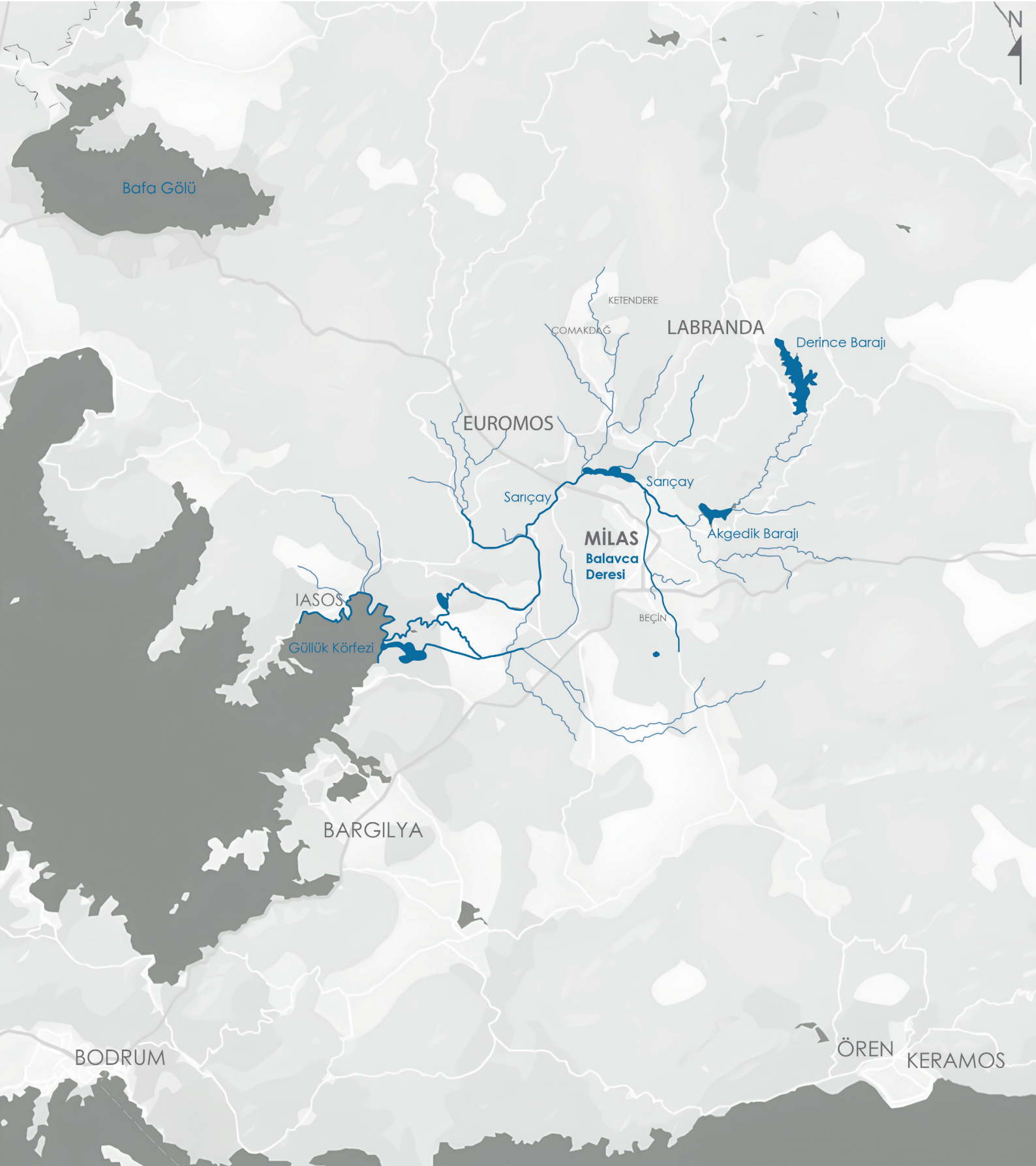
Şekil 1. Üst ölçekte, Sarıçay'ın hidrolojik havzasının tarihi ve güncel yerleşim ağı ile ilişkili bir bileşeni Balavca Deresi