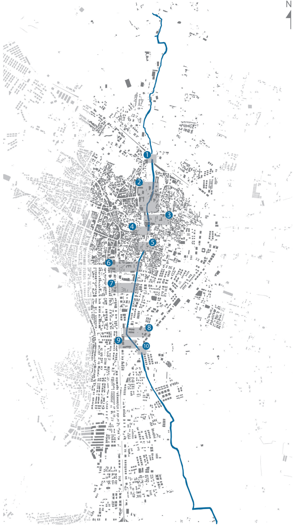
Şekil 3. Balavca Deresi'nin Milas kentsel yerleşim alanından geçtiği güzergâh boyunca etkileşim içinde olduğu önemli alanlar