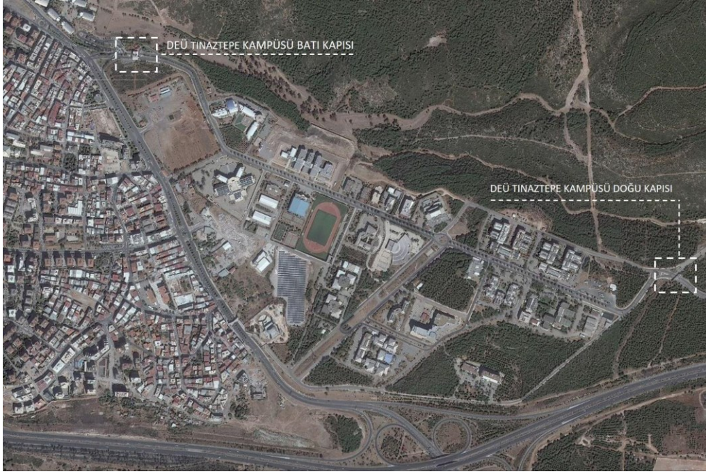
Şekil 1. DEÜ Tınaztepe Kampüsü uydu görüntüsü

Yarışmanın proje alanı olarak Dokuz Eylül Üniversitesi Mimarlık Fakültesi önünde bulunan giriş alanı seçilmiştir. Dokuz Eylül Üniversitesi Mimarlık Fakültesi, İzmir Buca Tınaztepe Yerleşkesinde yer almaktadır.