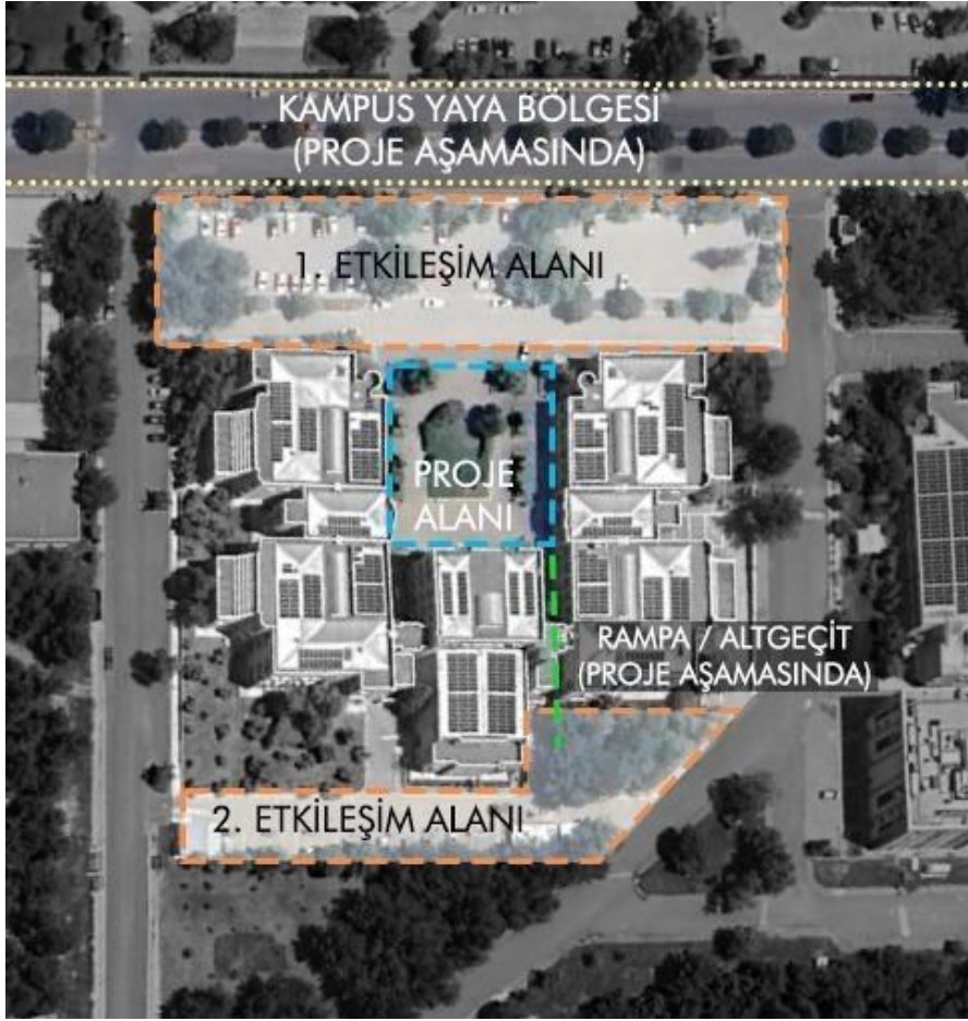
Şekil 3. Proje alanı ve etkileşim alanları

Tasarım alanı olarak belirlenen yaklaşık 1500 m 2 'lik alanın sınırları; DEÜ Mimarlık Fakültesi ve tören alanını da içeren giriş bölümünü ve giriş bölümü ile araç yolu arasında kalan yeşil alanı ve sert zemini kapsamaktadır.