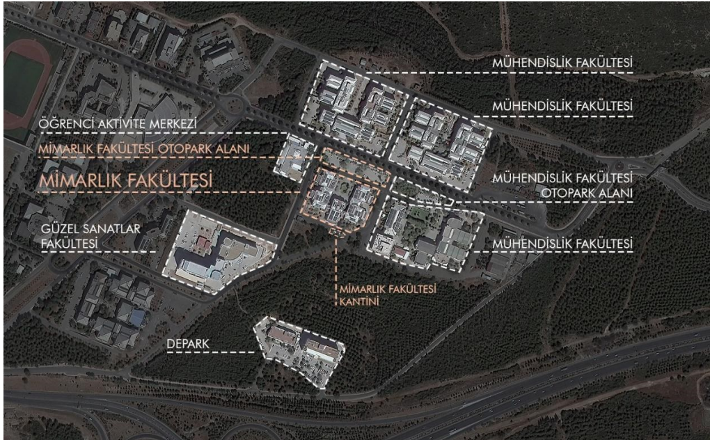
Şekil 2. DEÜ Mimarlık Fakültesi ve yakın çevresi ile ilişkisi