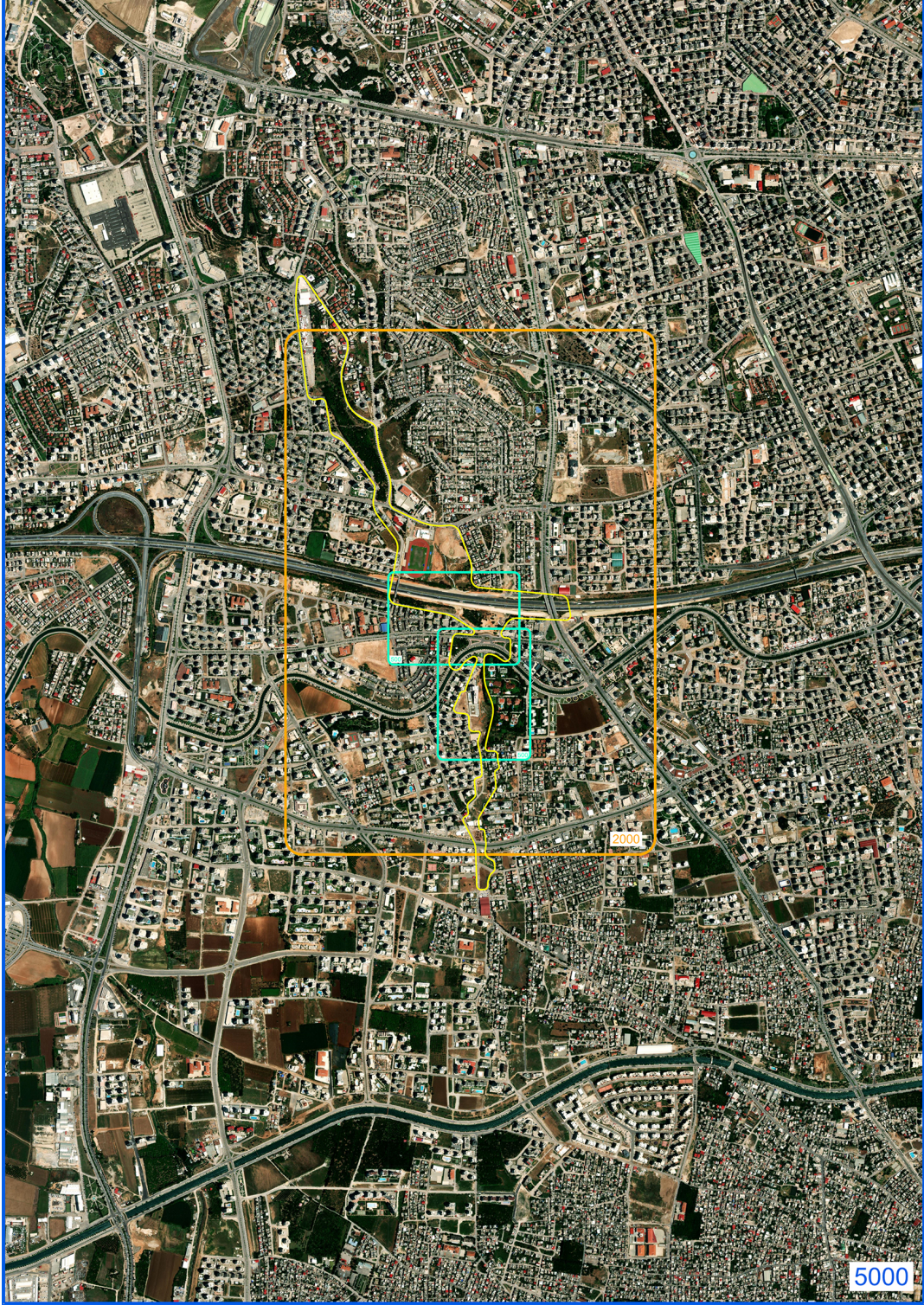
Şekil 1: 1/5000 Ölçekli Uzak Etki Alan Sınırları