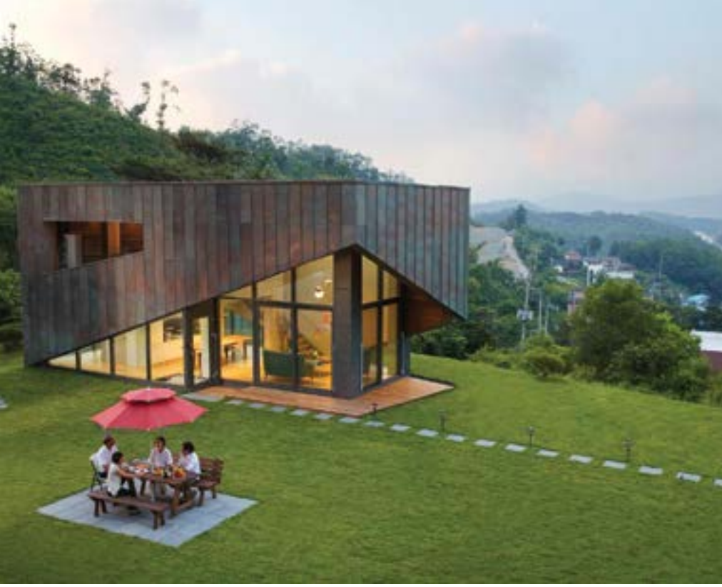
Samsung Metal Patina 4000 Copper