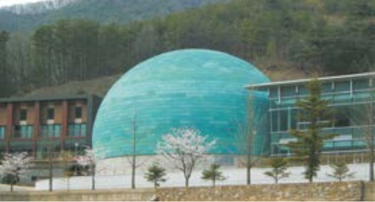
Samsung Metal SMC Patina 3000 Copper