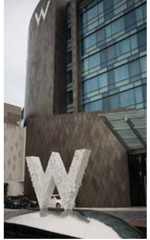
Samsung Metal Brown Coppers