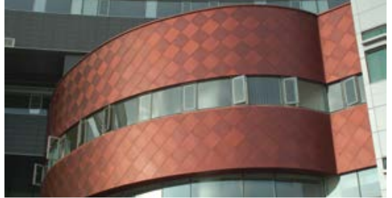
Samsung Metal Light Brown Copper