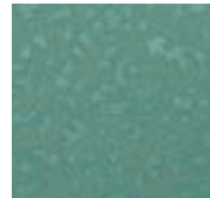
SMC- Patina 3000 Oksit Yeşil Bakır