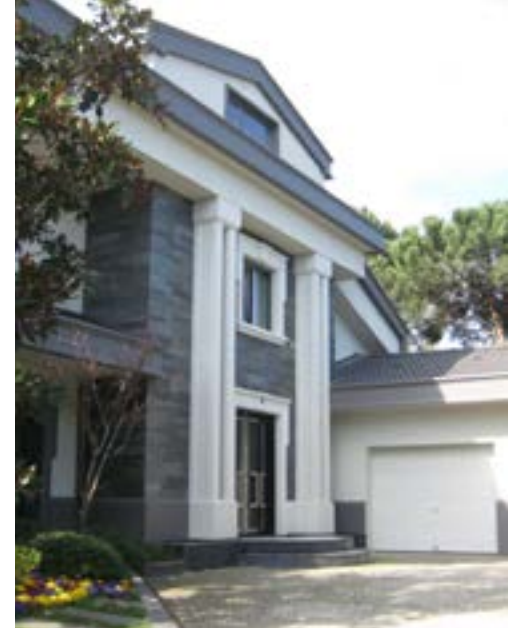
Zekeriyaköy Konakları, İstanbul