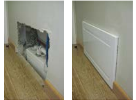
Duvar içerisinde gizlenmiş Sanipack